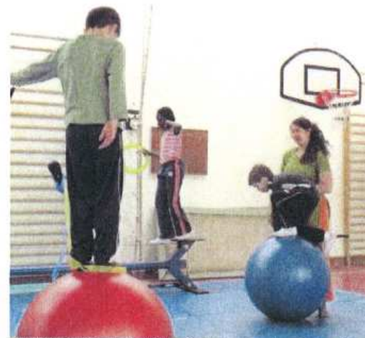
Le Plus Petit Cirque du monde (PPC) organise des stages pour les enfants pendant les vacances. C'est notamment cette activité qui lui a valu l'Etoile des quartiers de la parité et de la mixité de la part du conseil régional.

En octobre, Frédéric Mitterrand et Fadela Amam, respectivement ministre de la Culture et secrétaire d'Etat à la